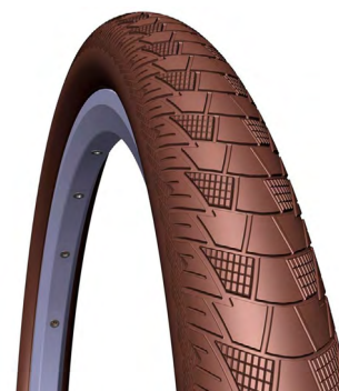
PNEU MTB CITYHOPPER

CÓDIGO: MED./TAM.: PESO: DESCRIÇÃO: 12492 CLASSIC 1020 29X2.00, CINZA.