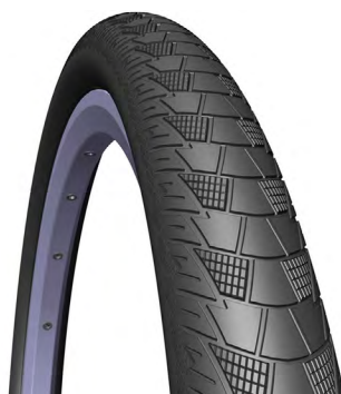
PNEU MTB CITYHOPPER

CÓDIGO: MED./TAM.: PESO: DESCRIÇÃO: 12489 CLASSIC 0,9 29X2.00, CREME. 12490 APS+RS 1020