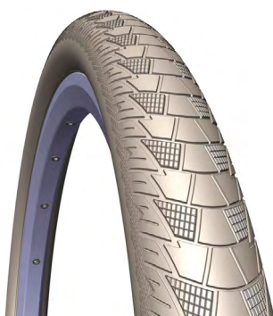
PNEU MTB CITYHOPPER

CÓDIGO: MED./TAM.: PESO: DESCRIÇÃO: 12487 CLASSIC 0,9 29X2.00, MARROM. 12488 APS+RS 1020