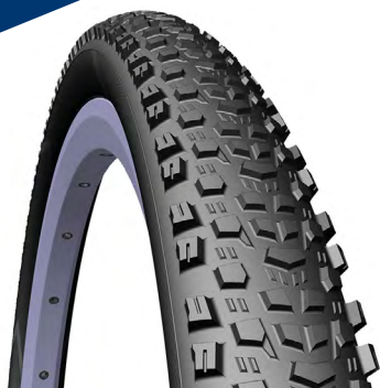
PNEU MTB SCYLLA

CÓDIGO: MED./TAM.: PESO: DESCRIÇÃO: 10268 TEXTRA TUBELLES 0,67 29X2.25, PRETO.