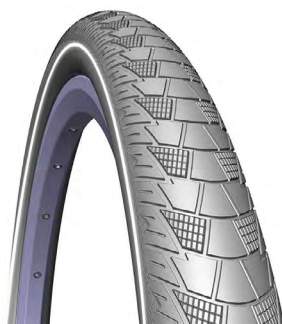
PNEU MTB CITYHOPPER

CÓDIGO: MED./TAM.: PESO: DESCRIÇÃO: 7650 TUBELESS 0,6 29X2.00, PRETO.