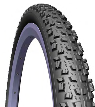
PNEU MTB KRATOS

CÓDIGO: MED./TAM.: PESO: DESCRIÇÃO: 12483 CLASSIC 0,9 29X2.00, PRETO.