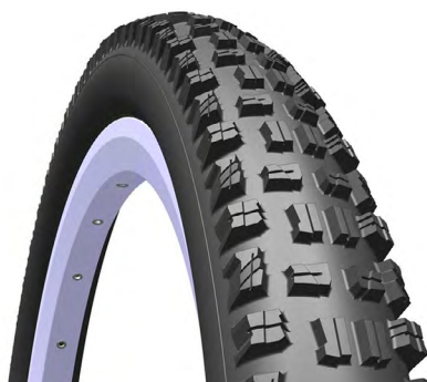
PNEU MTB HIGHLANDER

CÓDIGO: MED./TAM.: PESO: DESCRIÇÃO: 10268 TEXTRA TUBELLES 0,67 29X2.25, PRETO.