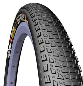
PNEU MTB ZEFYROS

CÓDIGO: MED./TAM.: PESO: DESCRIÇÃO: 11850 TEXTRA 1,03 29X2.45, PRETO.