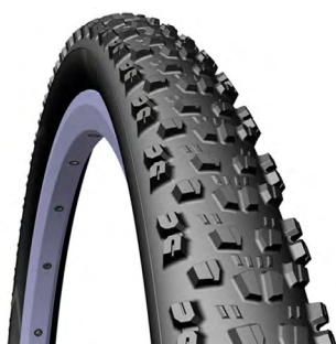
PNEU MTB CHARYBDIS

CÓDIGO: MED./TAM.: PESO: DESCRIÇÃO: 10096 TEXTRA TUBELESS 0,55 29X2.25, PRETO.